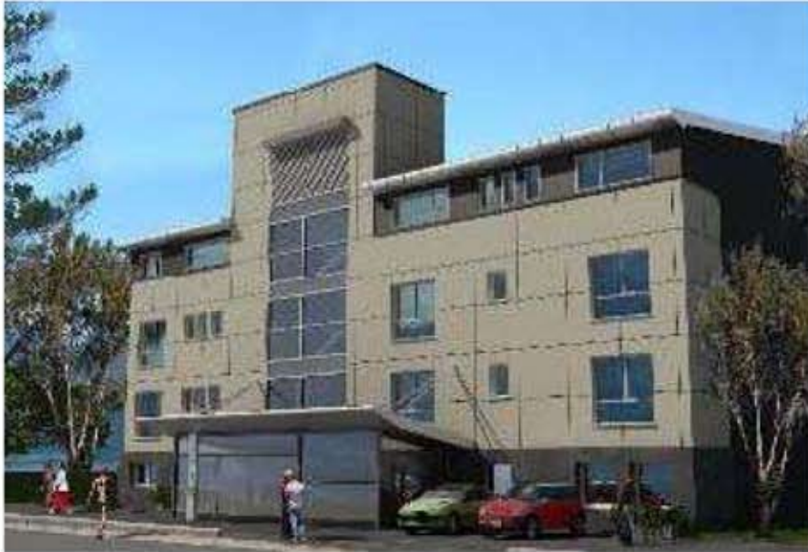
Fachada – Vista Final Salta