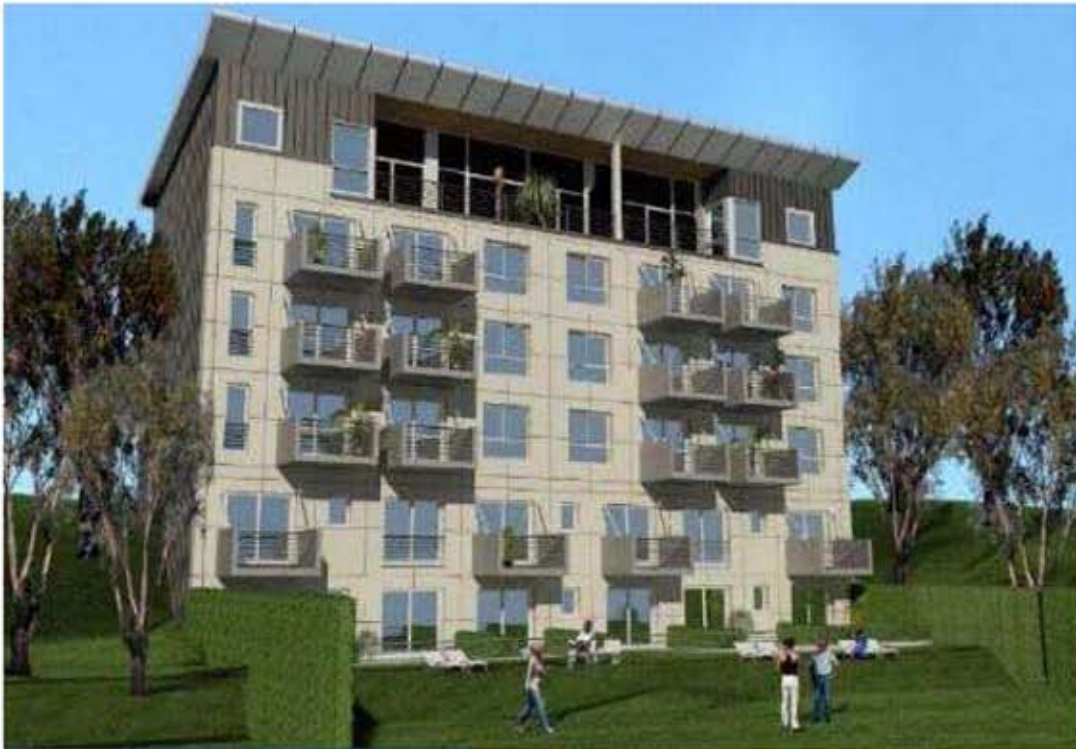
Fachada – Vista final Lago